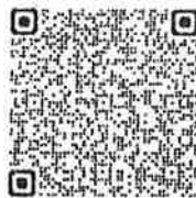
สิ่งที่ส่งมาด้วย ๒