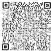
สิ่งที่ส่งมาด้วย ๑